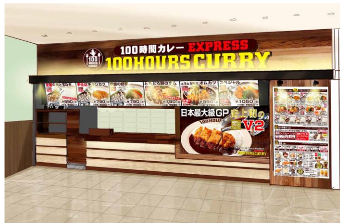
「100 時間カレーEXPRESS ニッケコルトンプラザ店」の外観パース

オープンを記念して、同店では8月28日(金)～30日(日)の間、ご自宅で100時間カレーの味が楽しめるレトルトカレーを差し上げるキャンペーンを開催します。